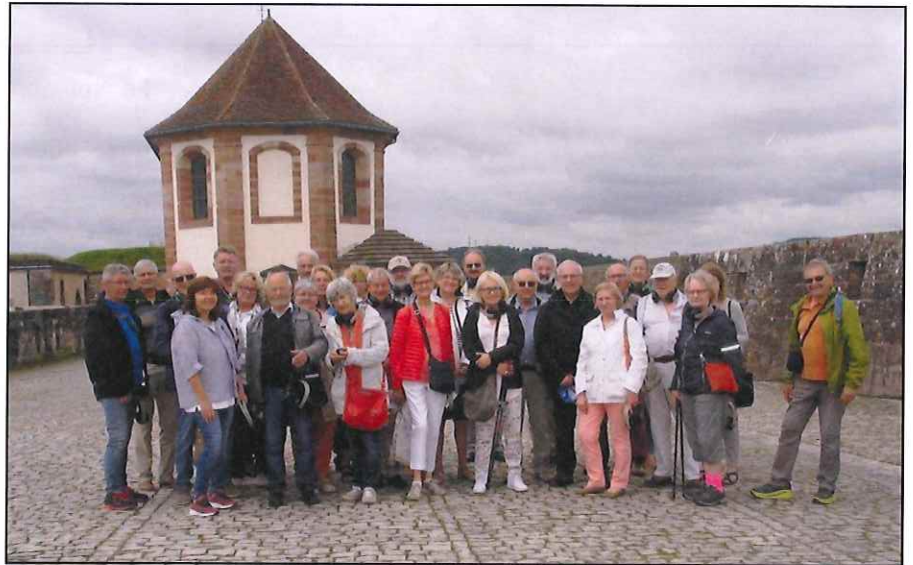
Le groupe franco-allemand visite la citadelle de Bitche