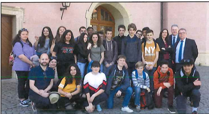
... et au Landratsamt d'Amberg par Richard Reisinger photo collège d'Epernon

Cet échange fut très positif et les adieux furent difficiles ... mais beaucoup se sont promis de se revoir cet été !