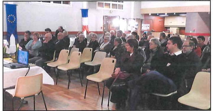
L'assistance lors de l'assemblée générale