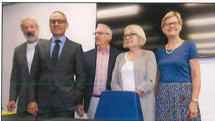
En visite au Parlement européen