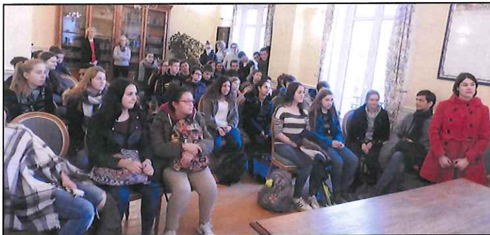
Français et Allemands sont reçus à la mairie d'Epernon ...

Un nouvel échange a eu lieu en mars et avril entre le collège Michel Chasles d'Epernon et le Lycée Max Reger d'Amberg. 21 lycéens allemands ont séjourné à Epernon du 15 au 23 mars, hébergés dans les familles. Ils ont assisté aux cours par petits groupes et ont découvert le mode de fonctionnement français. Ils ont visité la ville et ont été reçus par Madame le Maire. Une journée a été consacrée à la visite de Chartres, une autre à celle de Paris avec un croisière sur la Seine et une promenade sur les Champs Elysées. Le séjour s'est achevé avec la visite du château de Maintenon.